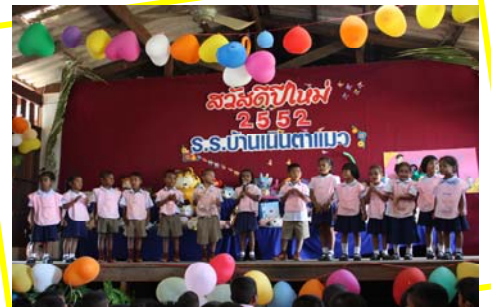
กิจกรรมของน้องๆ ที่แสนน่ารัก.....ก