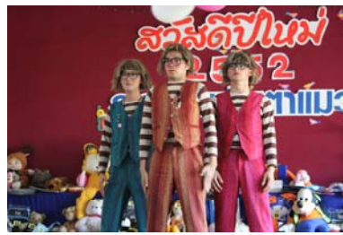
ได้รับการสนับสนุนความมาโดย BABY MIME