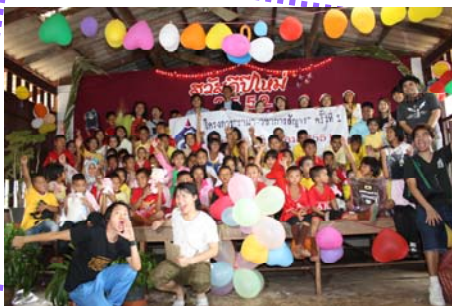
โครงการมอบของขวัญแด่น้องดีใจ (มีความสุข...กันทุก ๆ คนเลย)