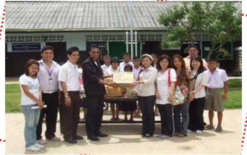
มอบเครื่องอุปโภคบริโภคเพื่อให้น้องอิม