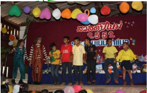
กิจกรรมสันตนาการเพื่อเพิ่มพูนการเรียนรู้