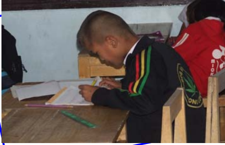
น้องๆ ที่ตั้งใจเรียนแต่ขาดแคลนทุนการศึกษา