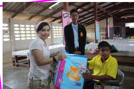
มอบของที่น้องๆ จำเป็นในชีวิตประจำวัน