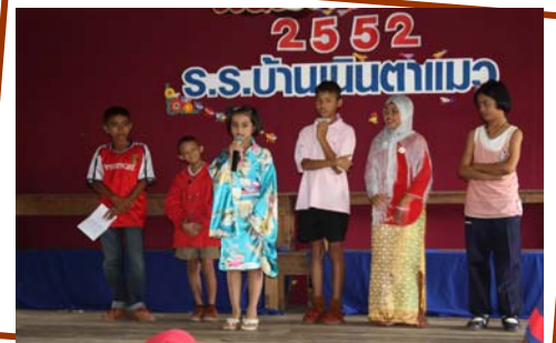
การแสดงความสามารถทางภาษาของน้องๆ