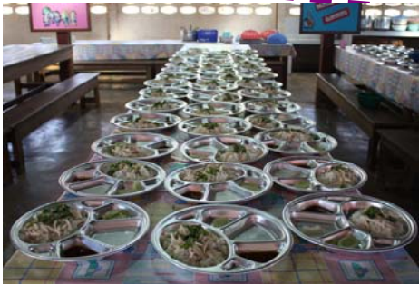
โครงการอาหารกลางวันสำหรับน้องๆ (น้ำหนัก้า.....มากมายๆ)