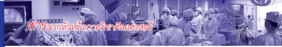
สำเนาจากหัวหน้าภาควิชาศัลยศาสตร์

ภาควิชาศัลยศาสตร์ คณะแพทยศาสตร์โรงพยาบาลรามาธิบดี มหาวิทยาลัยมหิดล ได้จัดการประชุมวิชาการประจำปี "Ramathibodi Surgical Forum" มาอย่างต่อเนื่อง สำหรับปีนี้ก็จะจัดประชุมภายใต้หัวข้อเรื่อง "Minimally Invasive Surgery : Basic and Advanced" ซึ่งนับเป็นเรื่องที่น่าสนใจและทันสมัยสำหรับวงการศัลยกรรมแทบจะทุกสาขา ในปัจจุบันนอกเหนือจากการบรรยายโดยวิทยากรผู้ทรงคุณวุฒิของรามาธิบดีแล้วเรายังมี วิทยากรจากสถาบันอื่นทั้งในและต่างประเทศเข้าร่วมด้วย รวมทั้งมีการทำ Live Demonstration และ Hands-on workshop ด้วย ซึ่งทางคณะผู้จัดฯ มั่นใจว่าผู้เข้าร่วมทุกท่าน จะได้รับความรู้จากการประชุมครั้งนี้เป็นอย่างดี ทั้งทางภาคทฤษฎีและภาคปฏิบัติ